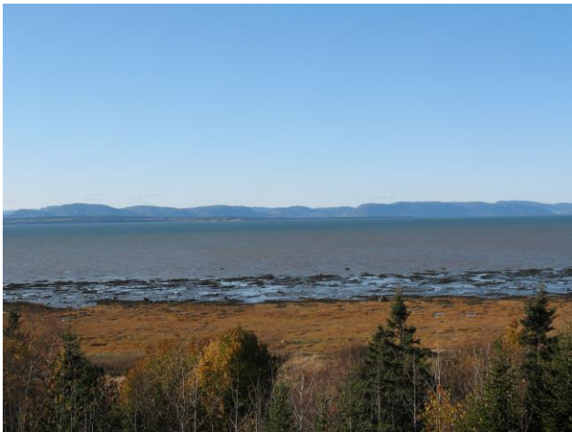
Vue sur le Saint-Laurent