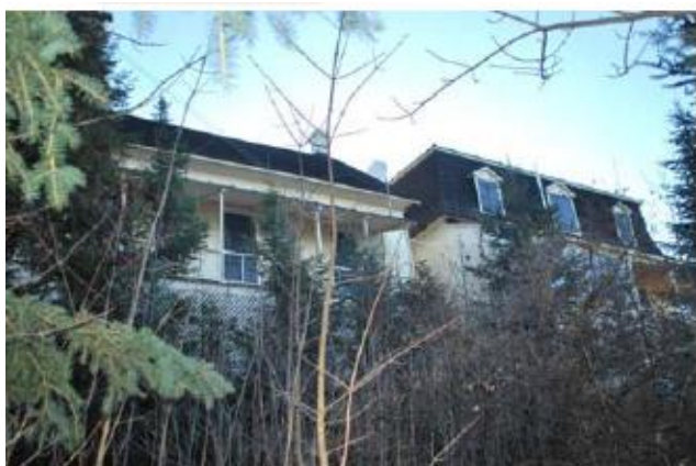
Vue arrière (côté Nord)