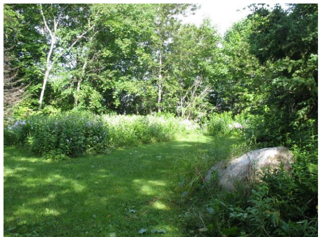
Section du jardin arrière de fleurs