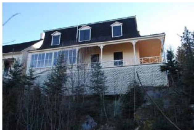
Vue arrière (côté Nord)