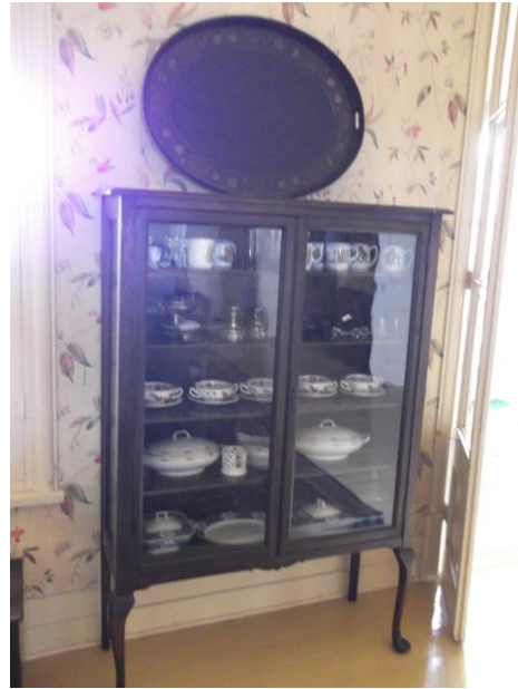
Vaisselle vintage dans la salle à manger