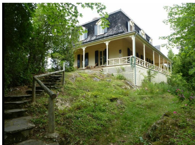
Entrée (côté Est)