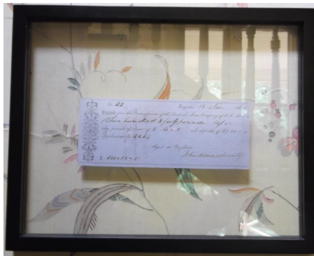
Vieux document avec la signature de Sir John A.