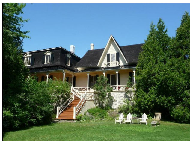
Vue du devant (Sud)