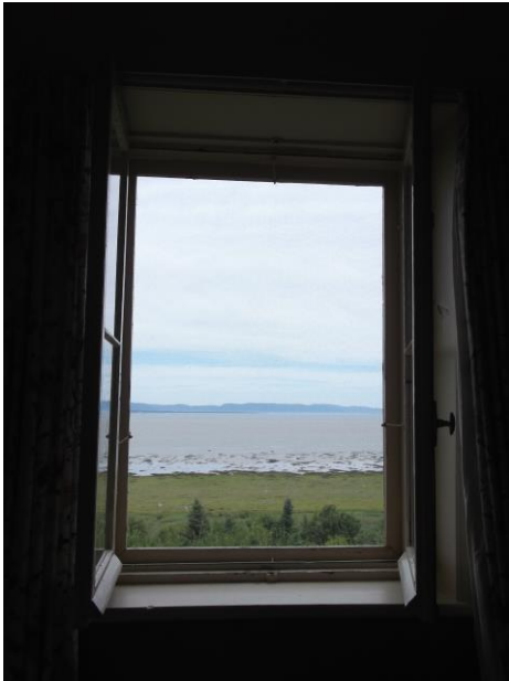
Vue sur le Saint-Laurent de la chambre