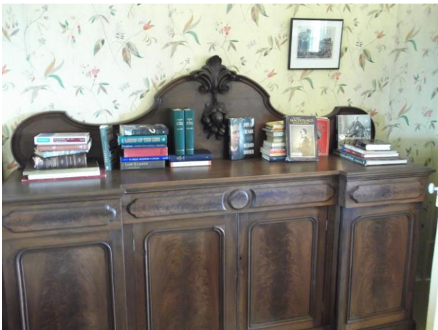
Mobilier dans la salle à manger