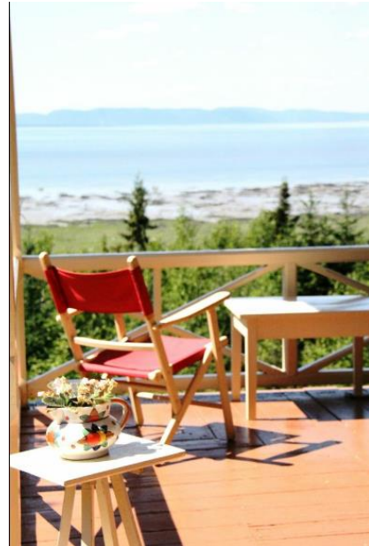
Vue sur le Saint-Laurent