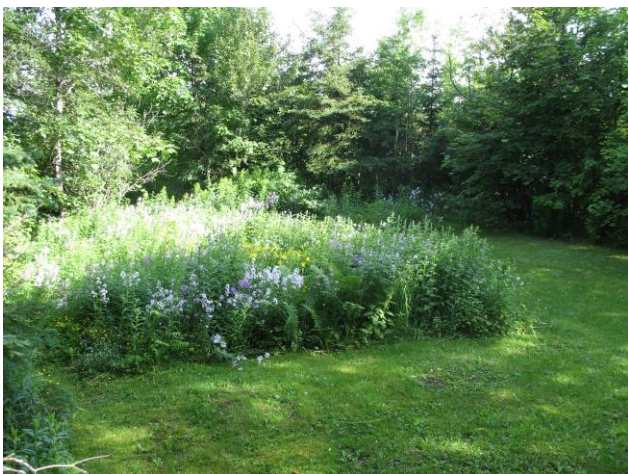
Section du jardin arrière de fleurs