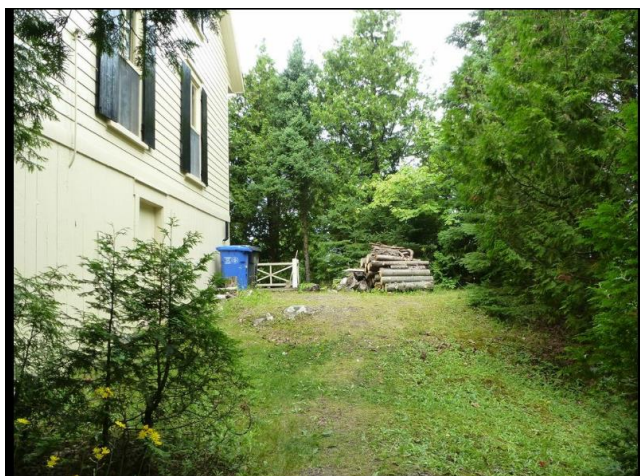
Vue (côté Est)