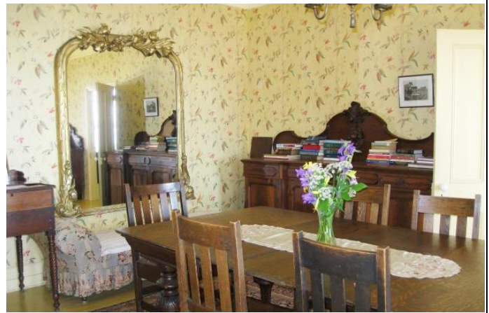
Mobilier dans la salle à manger