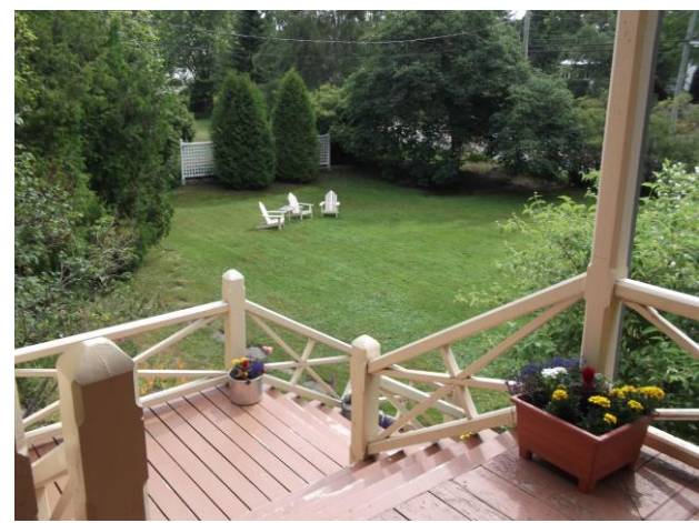
Espace avant pour le thé (Sud) Avec des plates-bandes de fleurs