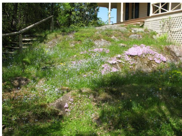
Jardin de fleurs dans l'entrée