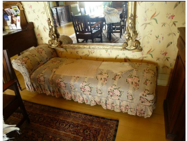
Mobilier de la salle à manger