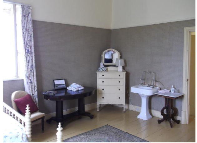
La même chambre