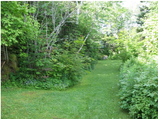
Sentier menant au jardin arrière de fleurs