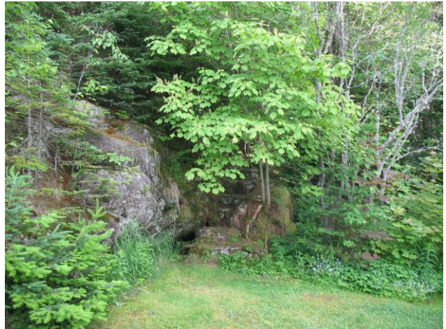
Vieil escalier de pierres menant au jardin arrière