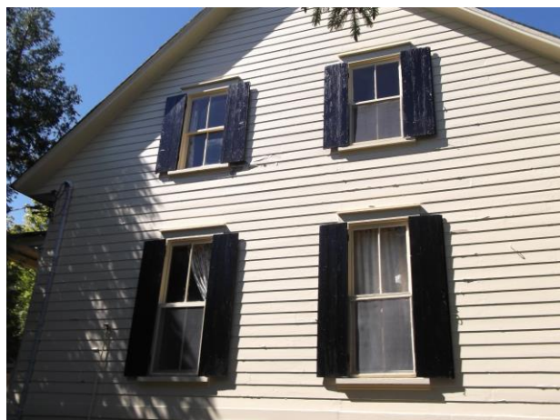
Vue (côté Est)