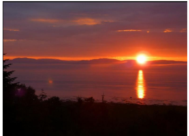
Vue sur le Saint-Laurent