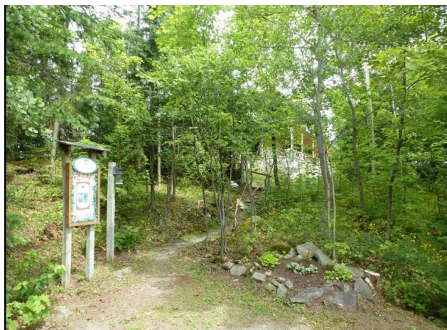
Entrée dans le stationnement menant à la maison