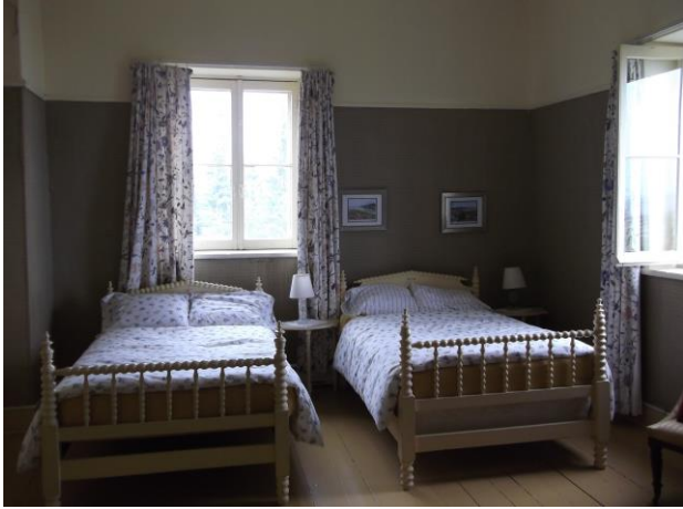
Une des chambres du 2 e étage