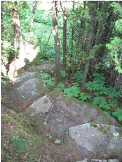
Vieil escalier de pierres menant au jardin arrière