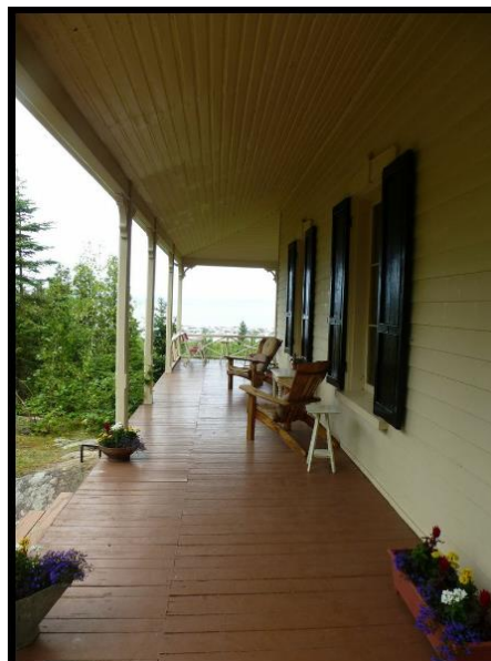
Galerie (côté Ouest)