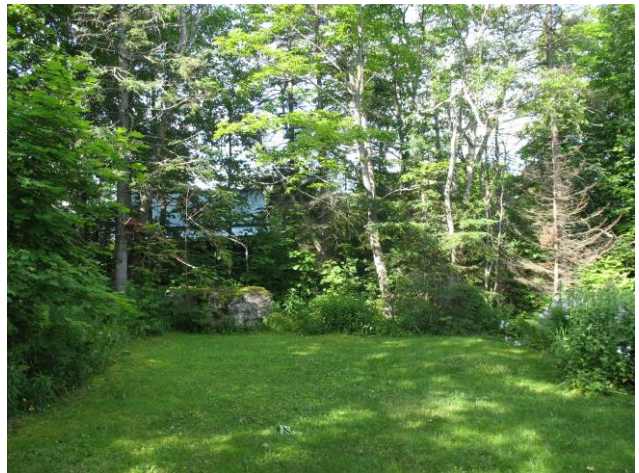
Section du jardin arrière de fleurs