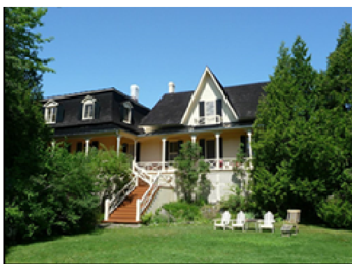
Le Gîte Les Rochers

Ce printemps, d'autres améliorations seront apportées au Gîte Les Rochers. 2016 sera une autre année bien spéciale pour cette propriété puisque nous soulignerons le 20 e anniversaire de l'ouverture du Gîte Les Rochers.