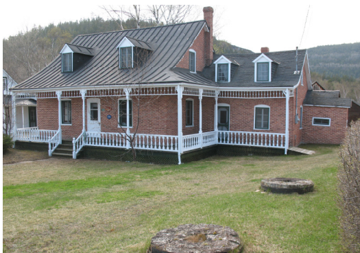
La Maison Molson-Beattie

Cette jolie maison historique (8 à 10 personnes) est fin prête à vous accueillir dès le mois de juin et ce, jusqu'à la fin septembre. C'est une occasion unique pour vous, votre famille et vos amis de faire un séjour inoubliable dans la région de Tadoussac.