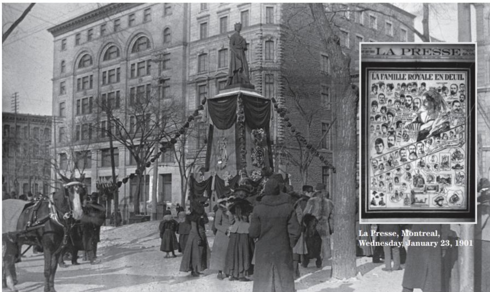
Mourning – statue of the Queen Victoria, Victoria Square, Montreal, January 21-23, 1901

La Presse, Montreal, Wednesday, January 23, 1901