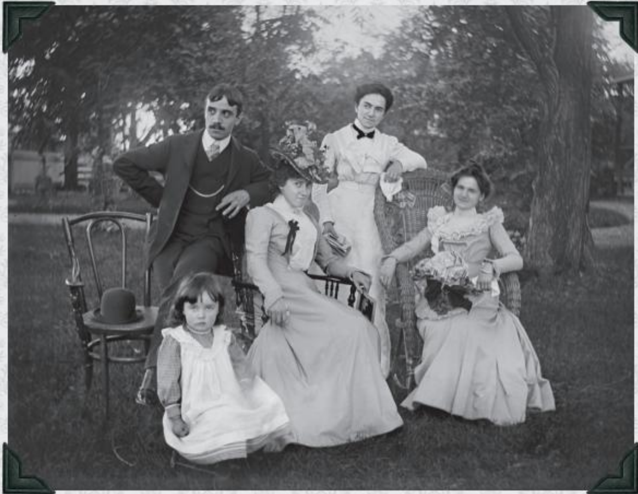
Famille Hurtubise dans leur jardin • Hurtubise family in their garden