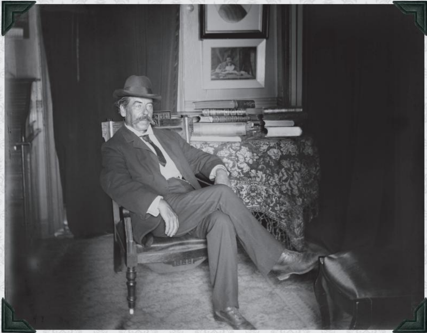
La Saint-Patrick • St. Patrick's Day