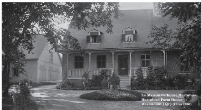
Exposition spéciale sur les photographies du Dr Léopold Hurtubise Special Exhibition on Dr. Léopold Hurtubise's Photographs